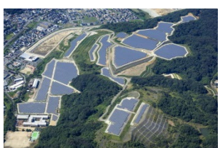
嘉麻第一太陽光発電所