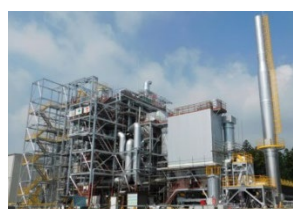
前橋バイオマス発電所