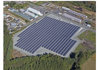
十和田太陽光発電所