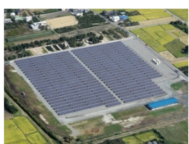
久留米太陽光発電所